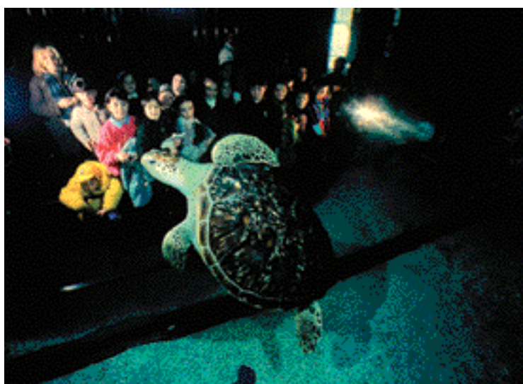
Animation scolaire autour du bassin de la barrière corallienne des Caraïbes, avec la tortue verte ( Chelonia mydas )

Avec ses 70 aquariums d'exposition qui hébergent 10 000 animaux, l'aquarium de Gênes accueille chaque année 1 300 000 visiteurs. Les bassins, qui contiennent 6 millions de litres d'eau, abritent 800 espèces animales vertébrées et invertébrées et 200 espèces végétales. L'aquarium de Gênes est en Europe l'établissement qui présente le plus grand nombre d'écosystèmes naturels : tropicaux, méditerranéens, d'eau douce. Une attention toute particulière est en outre donnée aux espèces présentes à Madagascar, qui a été déclaré pays symbole de la biodiversité ; une grande partie du parcours des expositions du « grand navire bleu » – l'agrandissement de l'aquarium inauguré en 1998 –, est en effet dédiée à l'île Malgache avec la reconstitution de la forêt ombrophile et d'une lagune corallienne. En plus de la lagune de Madagascar, le parcours des expositions possède 4 autres bassins océaniques qui permettent d'admirer sur deux niveaux différents, les écosystèmes reproduits et les animaux qui y vivent : les phoques, les requins, les dauphins, la falaise corallienne des caraïbes.