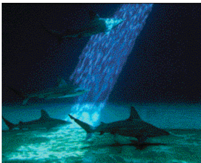
Le bassin des requins

Au-delà de la présentation des spécimens remarquables de la faune et de la flore aquatique, les aquariums consacrent une part essentielle de leur activité à des missions d'information sur l'environnement marin et de sensibilisation à sa protection. Cet entretien avec l'une des responsables de l'aquarium de Gênes met en lumière la diversité et l'importance des actions qui peuvent être menées dans ce domaine.