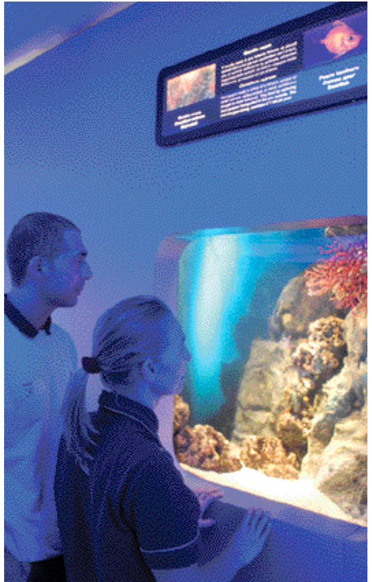
Le bassin des zones marines protégées © Aquarium de Gênes