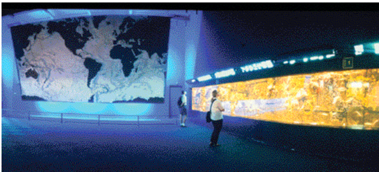
La salle de l'ancienne jetée

Aujourd'hui, la « Section didactique » de l'aquarium de Gênes, dont les activités sont reconnues par la direction régionale pour la Ligurie du ministère de l'Éducation, de l'Université et de la Recherche scientifique et par l'Institut régional de Recherche éducative de Ligurie, est devenue une référence pour les professeurs : elle leur fournit les meilleurs instruments pour une utilisation efficace du parcours d'exposition.