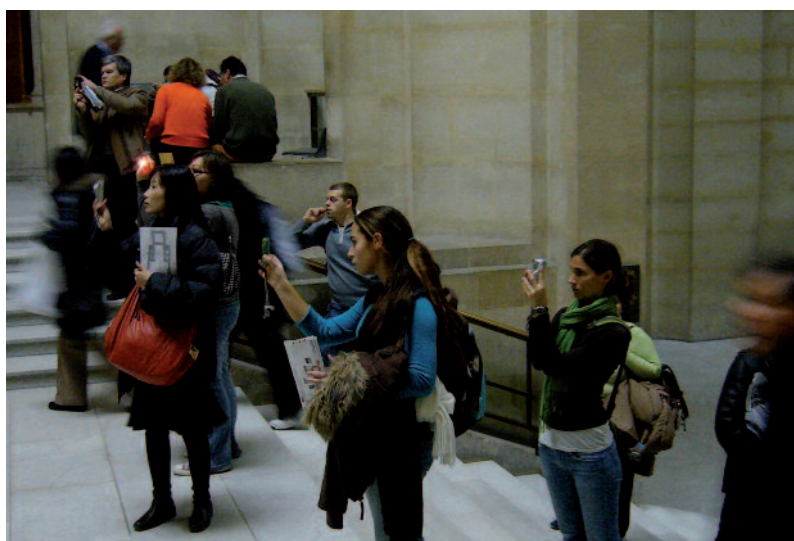
La multiplication et la densité des équipements photographiques (appareils numériques, caméscopes, téléphones) rendent parfois difficile tout contrôle.

Dans l'interdiction de toute reproduction photographique, on peut malheureusement aussi déceler une interprétation erronée de la notion de droit de reproduction. Ce qui est interdit au titre du droit d'auteur