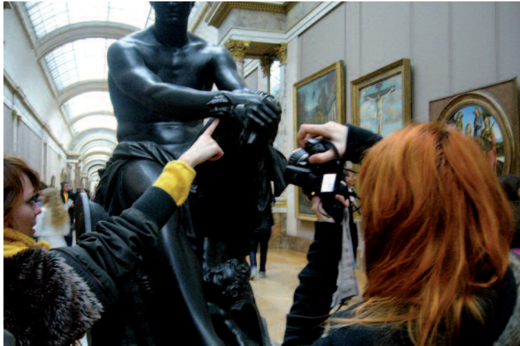
Personnaliser la visite...