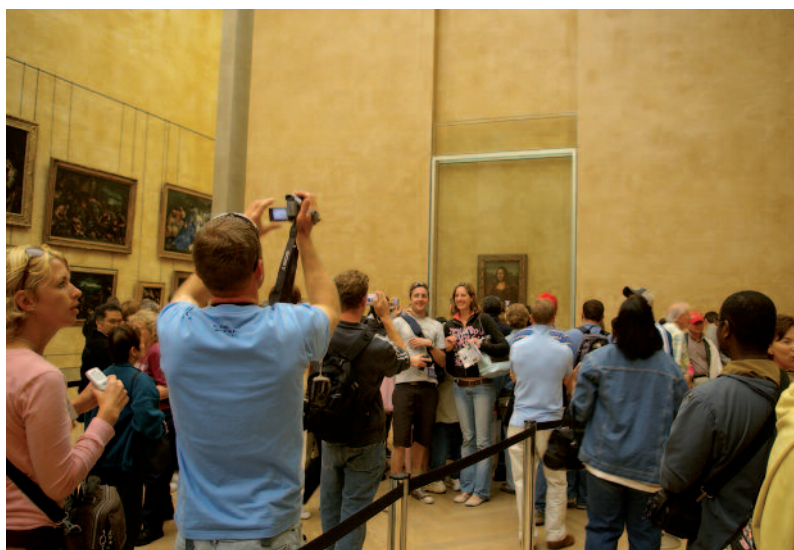
Prolonger la visite...

L'interdiction totale de la photographie appliquée par des institutions de plus en plus nombreuses est pourtant difficile à mettre en œuvre. Elle provoque des situations de lutte incessante entre les agents de surveillance, à qui cette consigne est donnée, et le