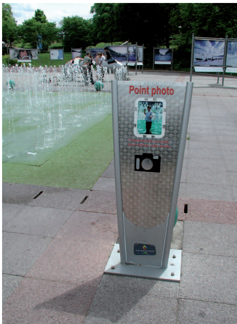
Parfois l'établissement (ici le Futuroscope) indique aux visiteurs le meilleur angle de prise de vue.

On pourrait aussi regretter que l'on confonde généralement dans l'interdiction de photographier la prise de vue des œuvres et celle de leur contexte. Même si cela est anecdotique, les muséologues sont souvent énervés de ne pouvoir photographier la mise en exposition sous prétexte du droit des œuvres.