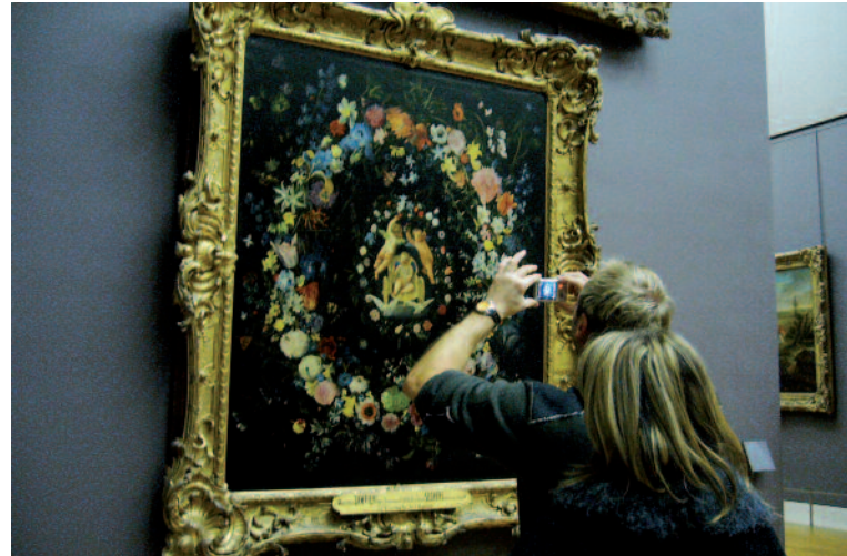
Garder un souvenir...

public. Soit le gardien finit par « fermer les yeux » ou détourner son attention pour éviter le conflit, soit il passe son temps à faire une chasse aussi vaine qu'inutile. Certains surveillants prennent un malin plaisir à montrer ainsi leur autorité, menaçant de confisquer appareil ou pellicule envers un photographe récidiviste, comme on gronde un enfant fautif. Le visiteur se transformant en mauvais élève à surveiller. Sans doute est-ce là un effet pervers d'un métier peu valorisant, mais qui l'est d'autant moins qu'on l'oriente vers des fonctions purement disciplinaires et coercitives. L'invitation à être des instruments de police davantage que des aides aux visiteurs peut impulser un climat détestable dans l'institution. Il y a bien sûr d'autres interdits à faire respecter dans un musée, mais celui de photographe, quand c'est le cas, joue un rôle récurrent et vite obsédant. La disjonction entre le rôle attribué au gardien et son intérêt réel est d'autant plus flagrant.