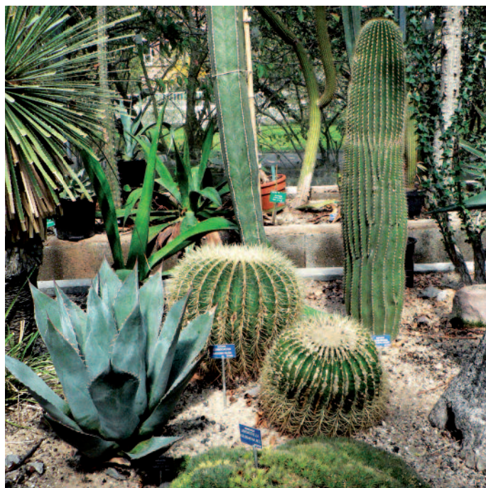
Le jardin botanique de l'université de Strasbourg

À cette difficulté de donner de leur contenu une image simple et claire pour le grand public, et à la fréquente pénurie d'objets de qualité muséale, s'ajoute souvent un manque de personnel dédié et qualifié et des ressources financières insuffisantes. Les musées et collections universitaires sont donc bien mal armés pour s'inscrire dans le marché des musées, ou des autres activités liées à l' edutainment (3) , qui sont pourtant leurs concurrents dans les choix d'activités de loisirs du grand public... et du public étudiant.