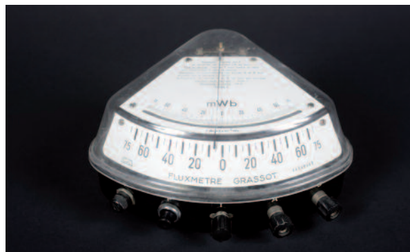
Fluxmètre, collection de Physique, université de Bourgogne

Prenons un exemple dans une très grande institution The Royal Institution of Great Britain . Celle-ci possède de nombreux objets et archives appartenant à Faraday. Elle dispose même de son laboratoire. Elle a donc concentré son exposition sur la vie de ce savant et sur son influence dans l'histoire de la Physique (électricité). Partant de ce point de référence, elle a pu déborder pour parler d'autres sujets liés à l'électrophysique. Un tel choix donne automatiquement une légitimité à la présentation des collections et une vraie raison pour visiter le musée, car s'y joue l'émotion de confronter le vrai, l'authentique, l'unique, toutes choses que recherche le visiteur de musée : le lieu où Faraday a travaillé. La logique en œuvre devient celle des maisons historiques, ou centres d'interprétation, très populaires dans le monde des musées.