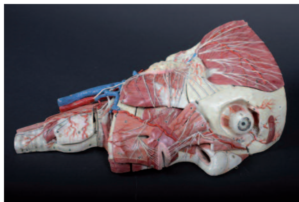
Modèle pédagogique, collection d'Anatomie, université de Bourgogne