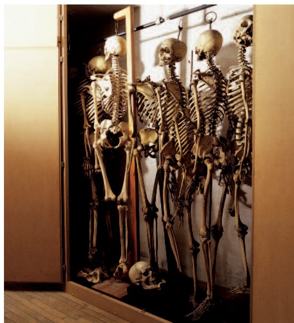
Armoire de rangement des squelettes, collection de l'institut d'Anatomie normale, université de Strasbourg

- Leur public est souvent très restreint. Quelques chercheurs, quelques amateurs éclairés y viennent sur une base volontaire, les étudiants y sont parfois amenés dans le cadre de leurs cours, de façon quasi