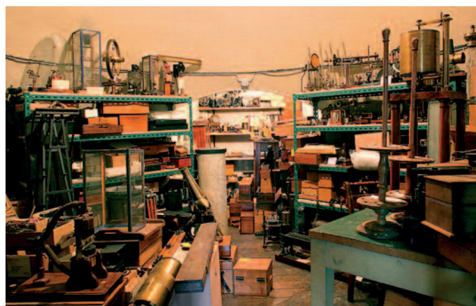
Réserve des instruments scientifiques à l'université de Strasbourg

Un premier problème découle de la difficulté pour ces projets de trouver un sujet cohérent qui pourrait constituer la base d'une institution reconnaissable de l'extérieur. Souvent, la question est traitée de manière « internaliste » ; je veux dire en examinant les principales caractéristiques des collections et en essayant de trouver une ligne cohérente entre elles. Cela conduit quasi inévitablement à créer un musée des sciences (ou de la connaissance) lato sensu . Par la définition de cette coupole très large, on espère intégrer des groupes d'objets très hétérogènes mais surtout on prétend refléter l'activité de recherche de l'université. Cependant le fossé est tellement large entre les objets, leurs significations intrinsèques, leurs contextes de récolte... et le travail scientifique réellement effectué dans ces institutions en ce début de XXI e siècle qu'une telle approche s'avère souvent impraticable. De plus, les collections universitaires couvrent rarement tous les domaines du savoir scientifique. Tout comme les recherches effectuées par une université sont généralement partielles et éclatées. Et il est rare que les richesses des unes concordent aux points forts des autres.